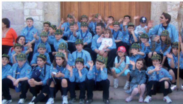
Nella Foto: il Branco AGESCI Lanciano 1°

La "Giungla" tratto dal libro di R. Kipling è l'ambiente fantastico dei lupetti e delle lupette del Branco Lanciano 1°.